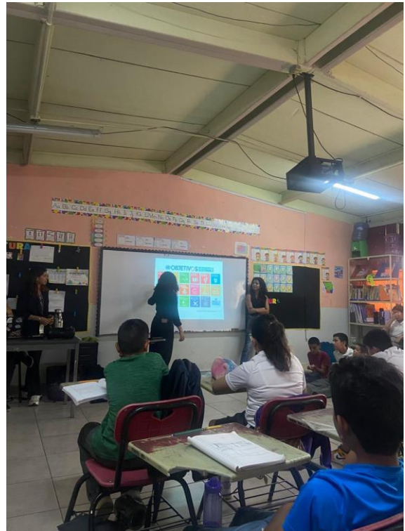
Taller de Ingeniería Aeroespacial en la Primaria Rosario Castellanos a niños y niñas de 5to y 6to.