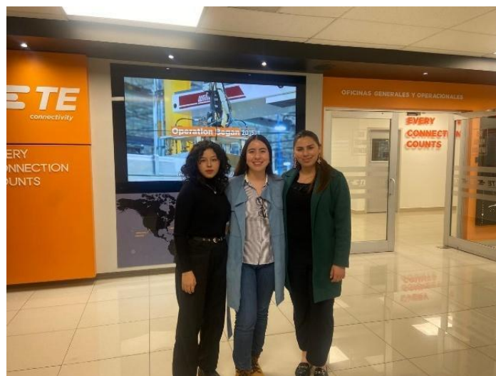
Actividad "Participación Juvenil en Foros de las Naciones Unidas".